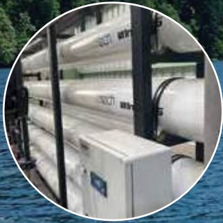
Ham Su Arıtma Sistemleri