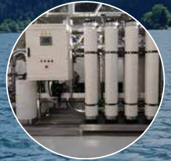
Su Geri Kazanım Sistemleri