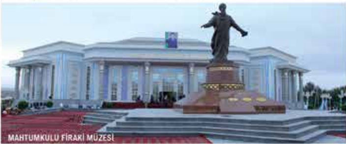
MAHTUMKULU FIRAKI MÜZESİ