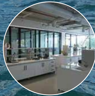
Akredite Laboratuvar Analizleri