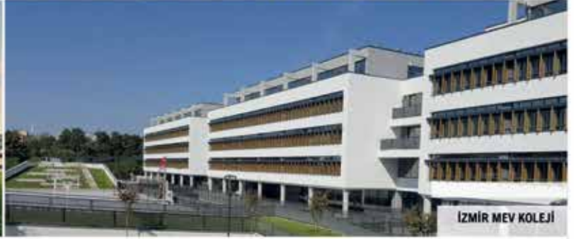
İZMİR MEV KOLEJİ