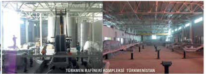
TÜRKMEN RAFİNERİ KOMPLEKSİ TÜRKMENİSTAN