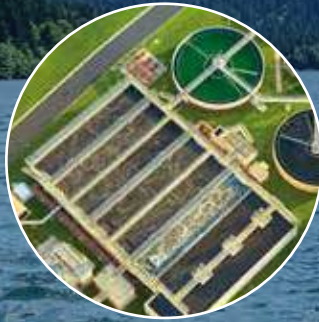
Atıksu Arıtma Sistemleri