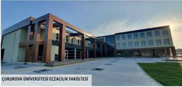
ÇUKUROVA ÜNİVERSİTESİ ECZACILIK FAKÜLTESİ

43 YILDIR, GÖRDÜĞÜNÜZ YAPILARDA, GÖREMEDİĞİNİZ ALTYAPIDA, KULLANDIĞINIZ ENERJİDE, YURT İÇİNDE YURT DIŞINDA YARATILAN İSTİHDAMDA, ONUN ADI VE KALİTESİ VAR.