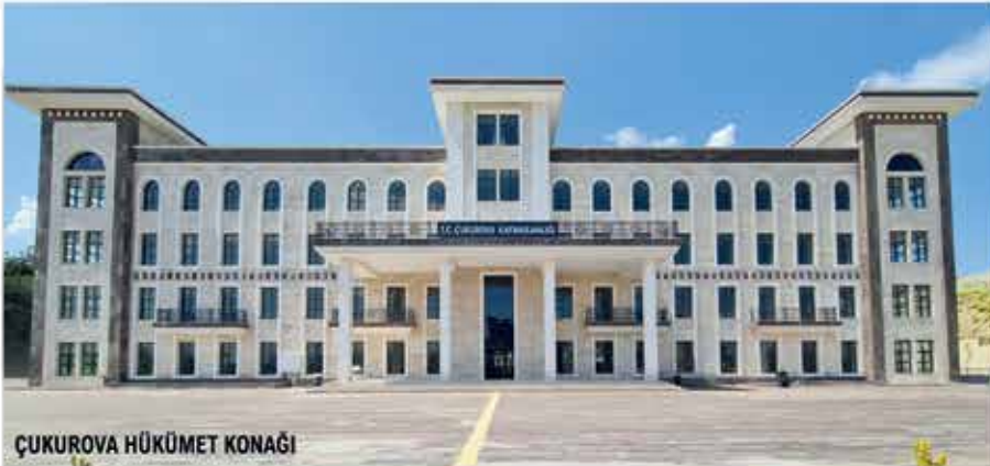
ÇUKUROVA HÜKÜMET KONAĞI